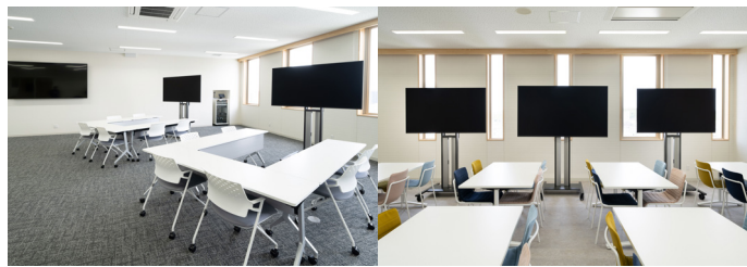
7 階演習室 (左)、7 階デザインラボ (右)。キャスター付きディスプレイとデスクを自由に移動し、さまざまな学びに対応できるようにしている。

数チームに分けたグループワークでの利用など、さまざまな用途で自由に配置して使えるようにしています。この際、どこに移動させても外光や照明の映り込みが少ない法人向けブラビア (BZ40L シリーズ) は良い選択肢でした。