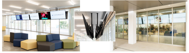
1 階ラウンジ。計 12 台の 65V 型ディスプレイ (FW-65BZ40L) を背中合わせに配置し、中からも外からも大学からの連絡事項を確認できるようにしている。

福原氏： トリニティホールの 2 階には学務部が入っており、当初から学生向けの掲示板をデジタルサイネージ化しようという計画がありました。ただ、それを 2 階に設置してしまうと、2,000 人以上いる学生が毎日、ホールの 2 階まで上がってこなければならず大変な混雑を招きかねません。そこで、1 階ラウンジに業務用ディスプレイを配置しつつ、ホール内に入らなくてもガラス越しに外からも見られるような 2 面構成にすることで混雑を回避しようと考えました。