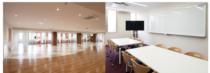
6 階ラーニングcommons (左)、6 階自習室 (右)

福原氏： まだ、開設から 1 か月も経っていないので (取材は 2024 年 4 月に実施)、その導入効果は未知数なのですが、映り込みの少なさを始め、その表示性能には十分な手応えを感じています。ぜひ、学生の皆さんには私たちが思いもつかなかったような使い方をしてほしいですね。