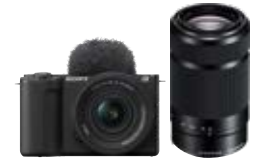
【ZV-E10M2X】 ダブルズームレンズキット