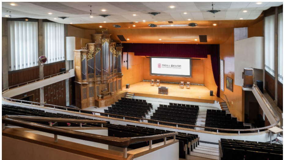
最大1,123名を収容可能なギール記念講堂

そのギール記念講堂において、音響や照明機器の老朽化に伴い、設備のリニューアルを計画。そのなかでソニーのラインアレイスピーカー『SLS-1A』の話聞き、実際に講堂内でデモを行うことになりました。関係者一同でその音を聞いてみると、1階、2階のどの席でもクリアな音声が届くことと、サイズもコンパクトで大規模な改修工事を必要としないことが決め手となり、導入を決定しました。また、本講堂のステージ左側には日本で唯一、中部ドイツバロック様式のパイプオルガンがあるのですが、このパイプオルガンのある厳かな雰囲気を考慮した設置位置を工夫してもらえたことも、導入の後押しとなりました。