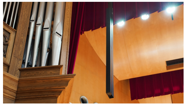
ギール記念講堂のステージの左右に設置されたラインアレイスピーカー『SLS-1A』（縦6連結）

福岡女学院は、キリスト教の精神に基づいて長い歴史を歩んできました。そのキリスト教活動の中心、ひいては本学の営み全体の中心といえるものが、ギール記念講堂でのチャペル礼拝です。月曜日から金曜日までの1時限目と2時限目の間に行われており、参加者にとって日常の中での静かな、自己発見の時間となっています。今回、音響機器や映像装置をリニューアルしたこのギール記念講堂が、本学の学生、生徒たちの心のよりどころとして、これからも永く愛されていく空間となることを願っています。