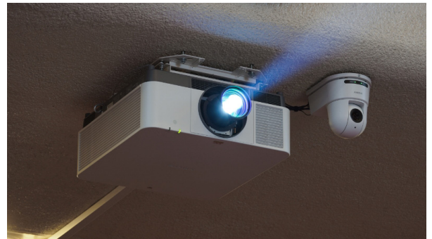
データプロジェクター『VPL-FHZ131』（左）とPTZオートフレーミングカメラ『SRG-A40』（右）