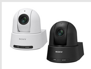
PTZ オートフレーミングカメラ 『SRG-A40』× 4台