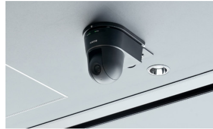
セミナールームに設置された PTZ オートフレーミングカメラ『SRG-A40』