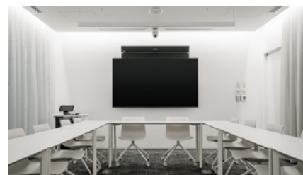
SRG-A40 とともに導入された法人向けブラビア