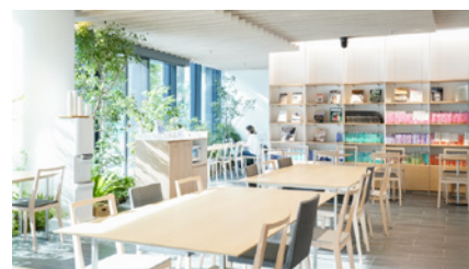
カフェの天井にも設置し入社式の様子を中継